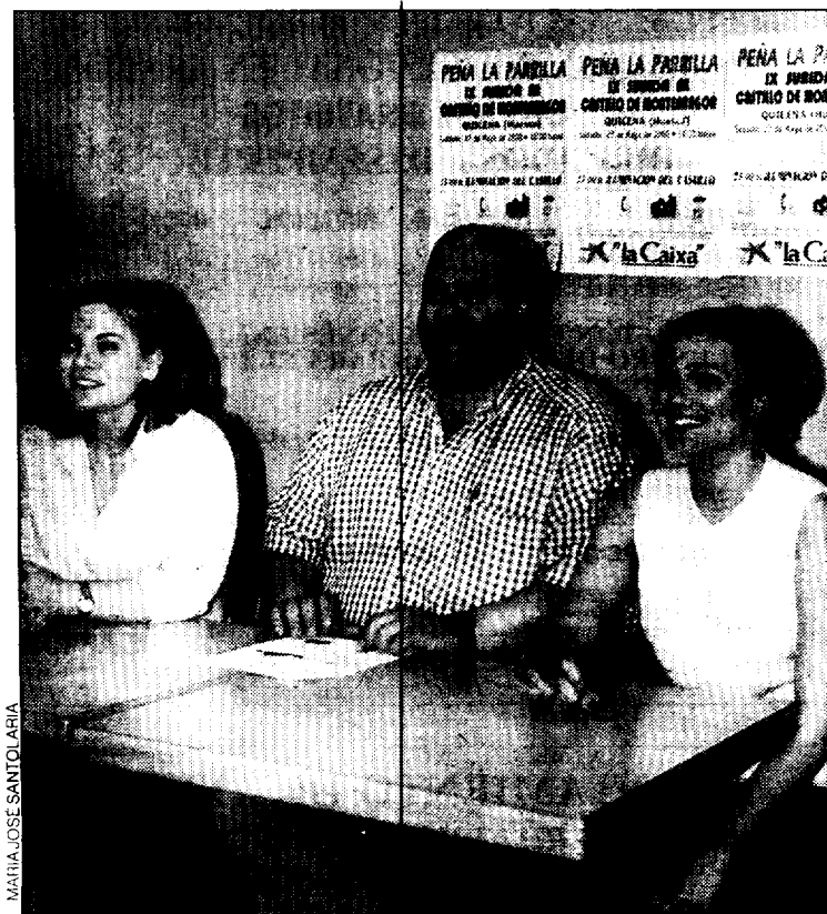
Un momento de la rueda de prensa celebrada ayer.

Hasta el momento hay cuarenta inscritos para la Subida al Castillo, que se disputará el sábado a partir de las 18 horas, aunque el plazo de inscripción concluye media hora antes del inicio de las carreras.