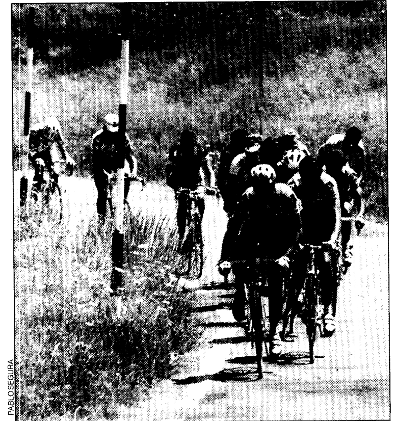
Los corredores deben superar las duras rampas de Formigal.

La principal ausencia en la prueba altoaragonesa será la del ciclista de Biescas, Fernando Escartín (Kelme-Artiach), que el año pasado se impuso con