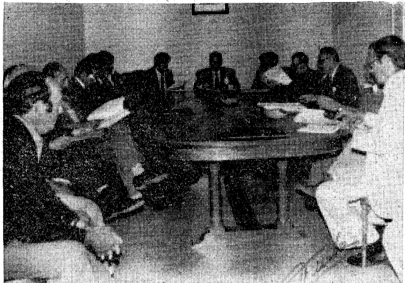
El gobernador civil, señor Gómez-Salvago, acompañado de varios delegados de la Administración en el transcurso de la reunión que mantuvo en el Ayuntamiento de Torla con la Corporación Municipal

Con este punto se dio por terminado el orden del día, pasando posteriormente a un hotel del pueblo para tomar un pequeño refrigerio.