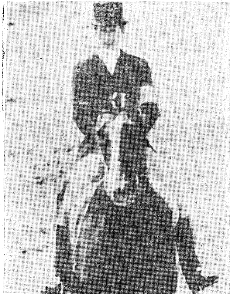
La princesa Ana, montada sobre el corcel en que ha intervenido, por cierto con escasa fortuna, en las pruebas de hipica de la presente Olimpiada. — (Foto Cifra).

Estas personas pueden ser sancionadas con multas de hasta 40 dólares.